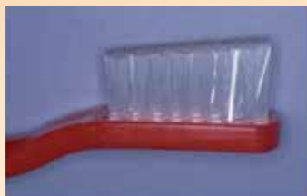
Brosse à prothèse