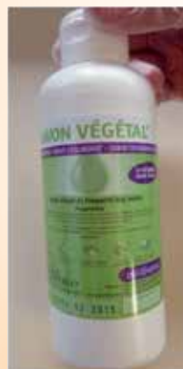
Savon neutre sans parfum