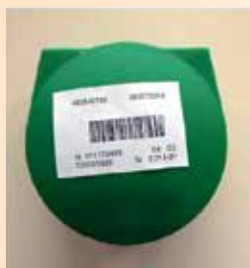
Boite à prothèse identifiée